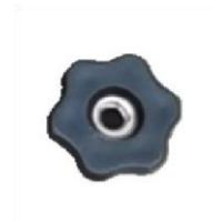
pokrętło x 8