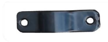
Wspornik montażowy X 4