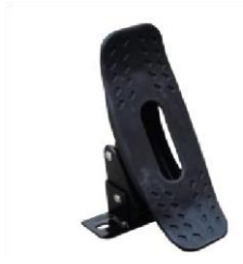
uchwyt X 4