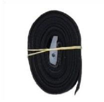
Pas X 2